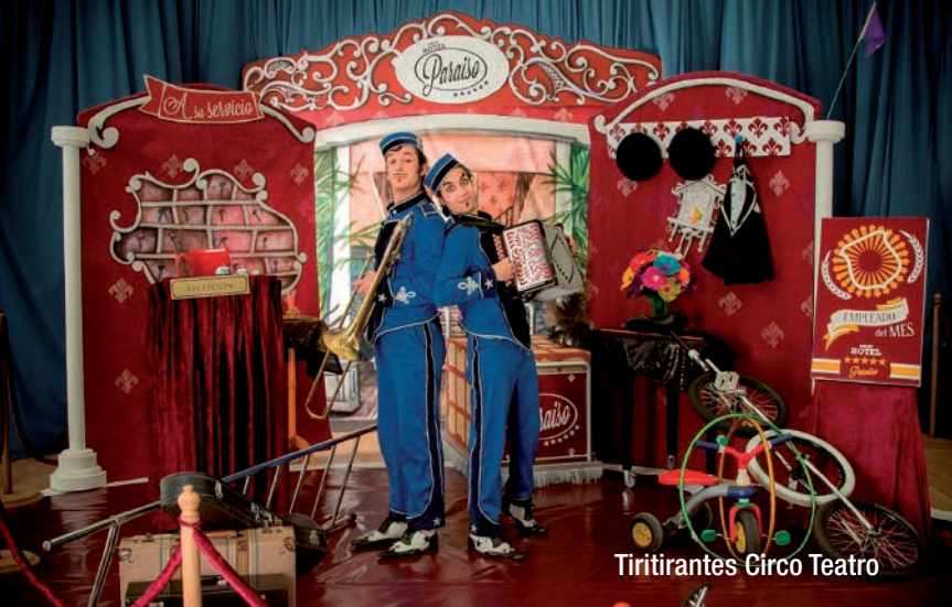
Tiritirantes Circo Teatro

Textos: Oscar Ortiz, Fernando Ballesteros