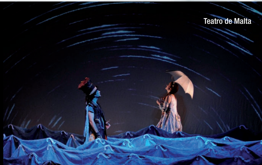
Teatro de Malta